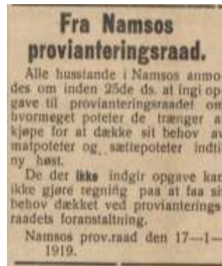
Namdalens Socialdemokrat (1919). 18. januar

helt til å stole på – heller ikke i forvaltningen av denne anordningen. Loven om provianteringsråd ble opphevet 7. desember 1923.