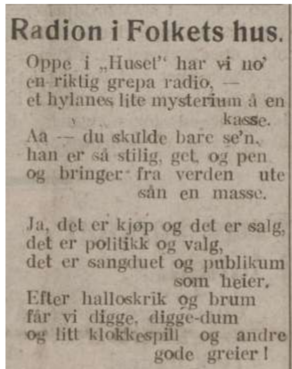
Namdal Arbeiderblad (1932). 14. september

På 1930 tallet ble det foretatt ommøbleringer i Folkets Hus, med utvidelse av både kjøkken, anskaffelse av større kokeovn. Kjent er også at det etter hvert oppsto et sterkt ønske om radio i Folkets hus. I 1929 tok 5 mann på seg oppgaven å arbeide for innkjøp av et radioapparat til Folkets Hus, og 1932 var radioen på plass. I den forbindelse kom det i «Namdal Arbeiderblad» en hyllest til den nyinnkjøpte radioen. Her gjengis noen av de første versene.