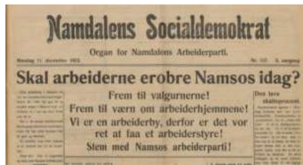
Namdalens Socialdemokrat 11. desember 1922.

borgerskapet en glimrende anledning til å få utnyttet arbeiderne i en vanskelig situasjon. «Derfor ser man ogsaa at de borgerlige med neb og klør holder fast paa at nødsarbeide skal være daarligere betalt enn andet arbeide». I Namsos strammet situasjonen seg til, og man arbeidet iherdig for å få til bl.a. et skifte i ordførerstolen. Fra avisene i 1922 kan man lese om kamp og motstand mot «utbytterinteressene». Samtidig kan man også lese om Arbeiderpartiets kriseprogram som gikk for arbeid og underhold for enhver arbeider, ethvert nyttig medlem av samfunnet. Den 11. desember samme år kom «Namdal Socialdemokrat» med følgende overskrift på første side: