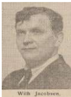
Namdals Arbeiderblad (1927). 28. februar