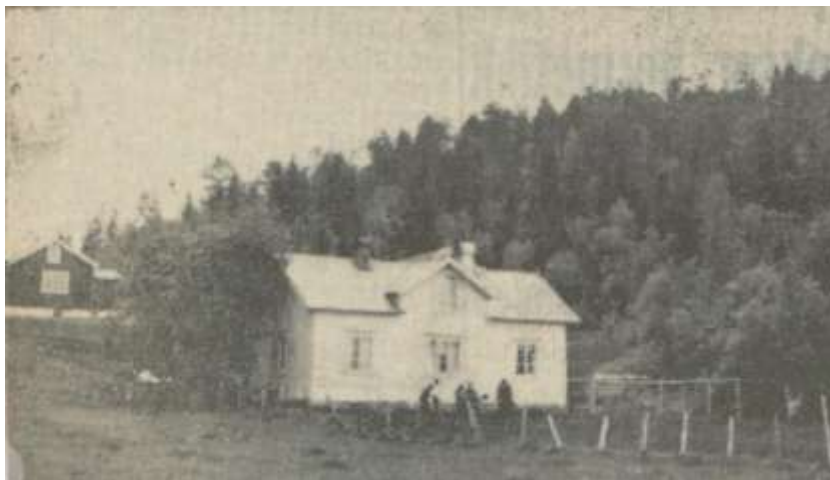
Feriehuset i Sandvika.