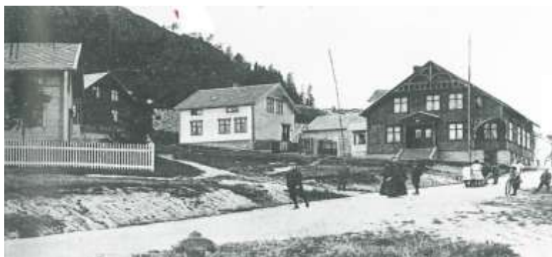
Folkets Hus i Namsos på toppen av partibakkan.