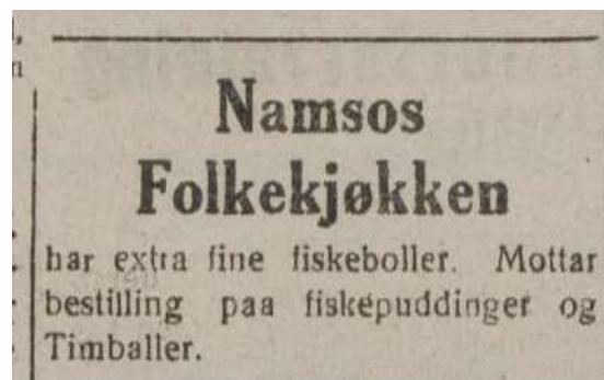
Nordtrønderen (1920).12. mars