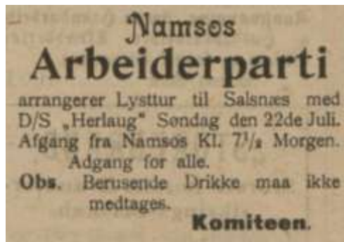
Nordtrønderen (1906).18. juli